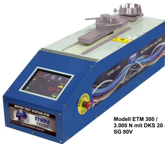
Modell ETM 300 / 3.000 N mit DKS 20 & SG 80V