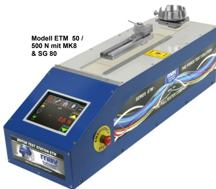
Modell ETM 50 / 500 N mit MK8 & SG 80