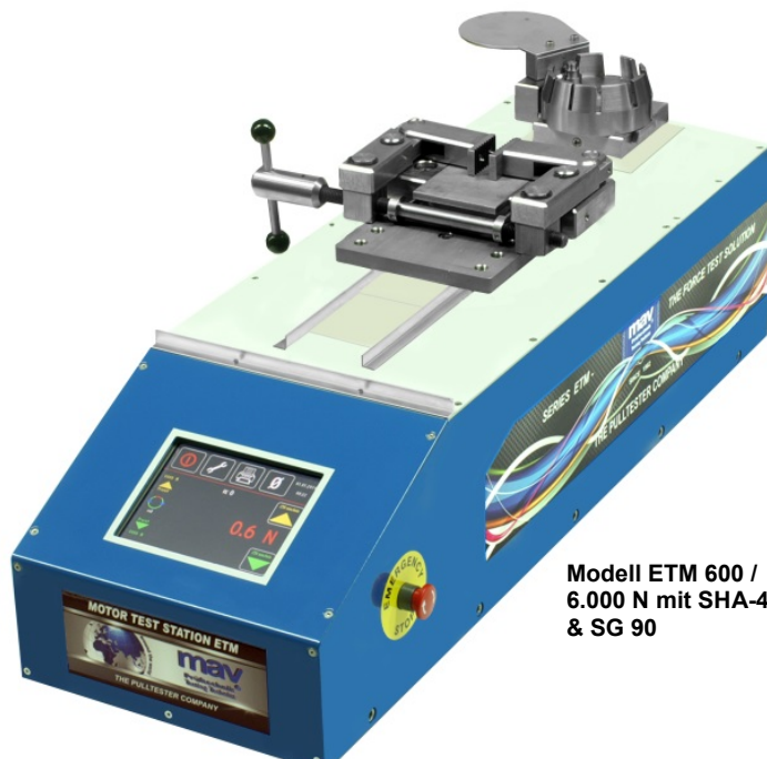
Modell ETM 600 / 6.000 N mit SHA-40 & SG 90